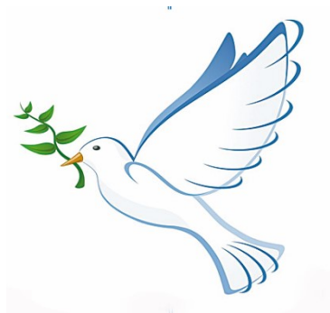
Symbol - peace dove

Our far-reaching responsibility demands that the policy directed against Russia and the current refugee policy are changed in favour of encompassing peaceful, logical and far-sighted measures.